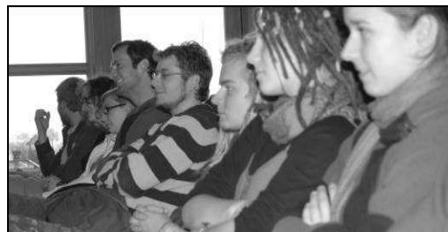
Buchlesung »Blühende Landschaften«

den Themen »Flucht«, »Lebensalltag in der DDR« und »Persönliche Erinnerung«. Im Foyer errichteten sie eine Mauer als künstlerisches Produkt. In einer Live- und Videoperformance demontierten sie diese Mauer und erspürten so die Folgen des Mauerfalls tiefer.