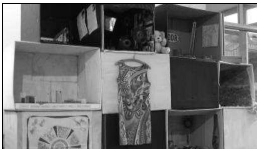
Mauerinstallation im Foyer

Die Klasse 10 gestaltete „Mauerstücke“ zu